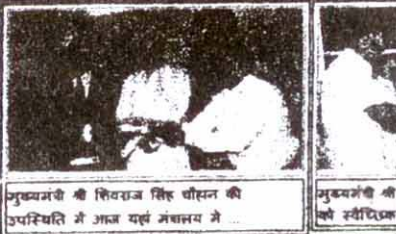
मुद्रणमंत्री श्री शिवराज सिंह चौहान की उपस्थिति में आज यहां संसदय में ...