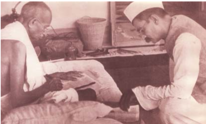
गांधी जी के साथ डॉ. राजेन्द्र प्रसाद