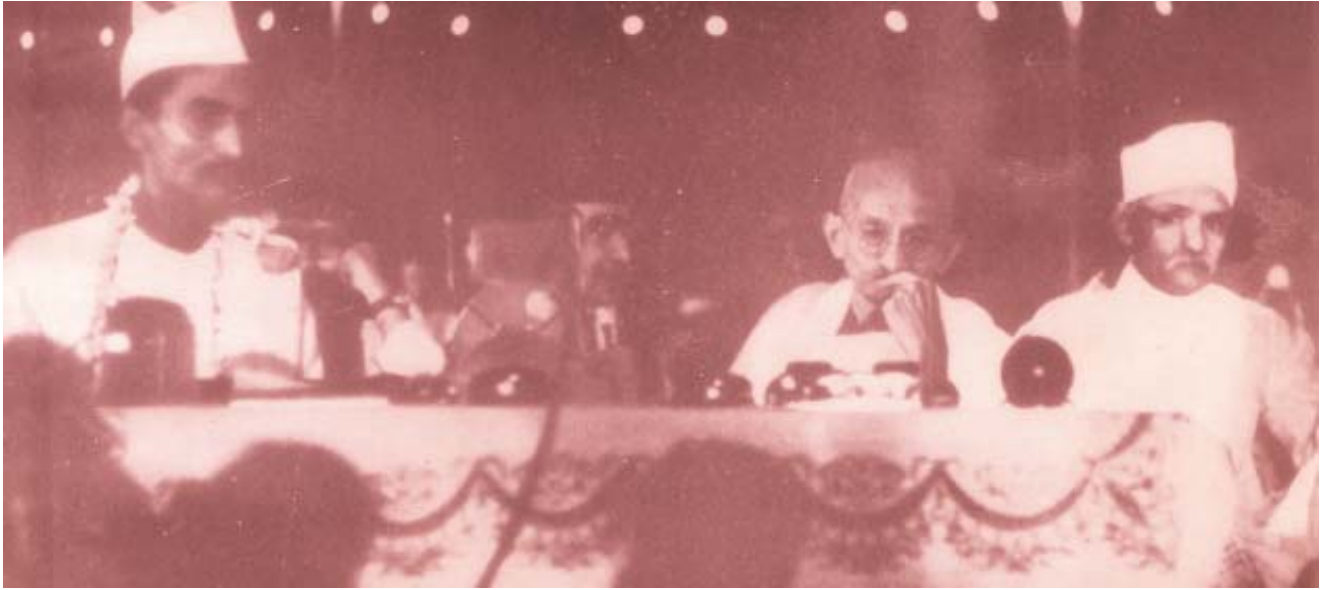
बाम्बे कांग्रेस अधिवेशन 1934 में डॉ. राजेन्द्र प्रसाद महात्मा गांधी जी और पंडित मदन मोहन मालवीय जी के साथ

पहुँचे। हजारों किसानों से उनका दुःख-दर्द सुना और उनकी गवाहियाँ रिकार्ड कीं। संघर्ष शुरू हो गया। राजेन्द्र प्रसाद लगातार गांधी जी के साथ रहे। संघर्ष में जीत हुई और किसानों को राहत मिली।